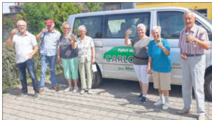
Die ersten Fahrgäste von „Carlow“: die Singegruppe „TE-LA-WI-DU“

Danach konnten wir endlich starten. Mit einem sehr großen (Einstiegs-)Tritt kamen meine etwas älteren Mitfahrer sicher und leicht auf ihre Sitze. Kaum waren sie im Auto, ging es los: schönste Gesänge begleiteten unsere Fahrt. Auch wenn ihre Gesichter mit komischen Masken verhüllt waren, war ihr Spaß eindeutig zu hören. Sie sagten, sie wären schon so lange nicht mehr gemeinsam unterwegs gewesen.