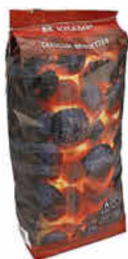
Grillbriketts 10 kg

Große Auswahl an Weidezaun-Geräten und Zubehör in unserem Landmaschinenlager.