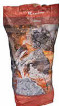
Grillkohle 10 kg