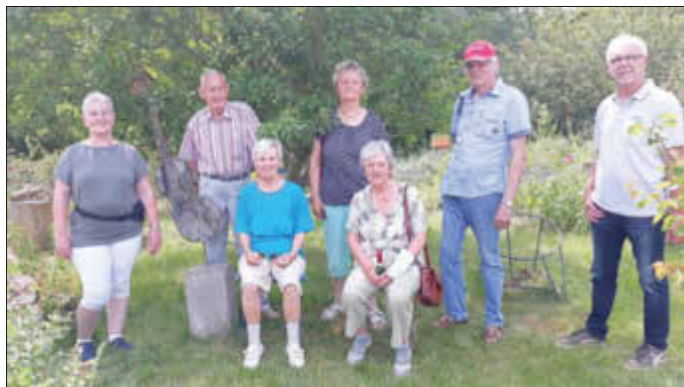
Die Singegruppe „TE-LA-WI-DU“ im Kräutergarten in Carlsthal