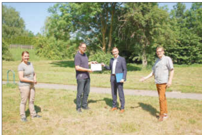
Scheckübergabe auf dem ehemaligen Spielplatz „Kleine Teichstraße“